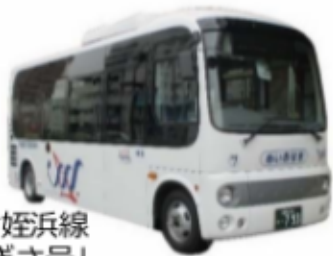
今宿姪浜線 「なぎさ号」